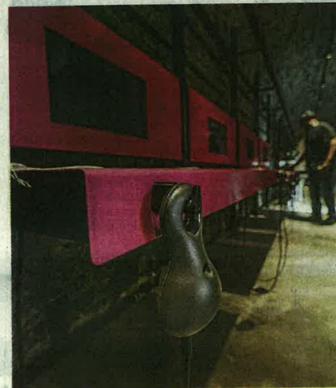
Le Climatographe de l'Aigoual à découvrir ce samedi.