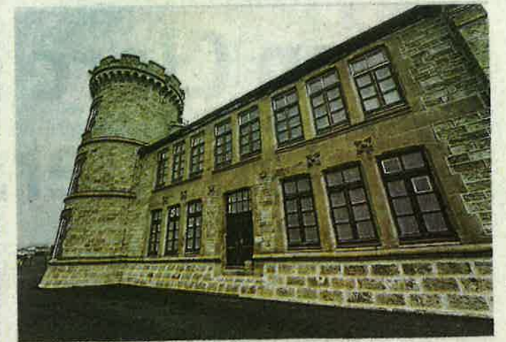
L'imposant observatoire du mont Aigoual abrite dix salles d'expo.